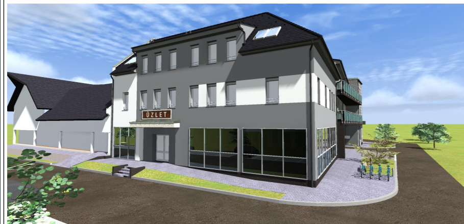
Kereskedelmi épület, és 16 lakásos társasház építése